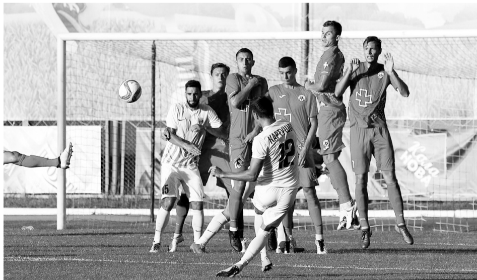
У нинішньому сезони одразу три колективи Першої ліги, теоретично, матимуть змогу підвищитися в класі.

Новий сезон колективи першої ліги розпочали з відчутно ширшими для себе горизонтами