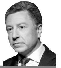
Курт Волкер спеціальний представник Державного департаменту США з питань України

«Оборонна зброя дозволила б Україні, наприклад, захистити себе і відвести танки та фактично допомогла б зупинити російську агресію щодо України».