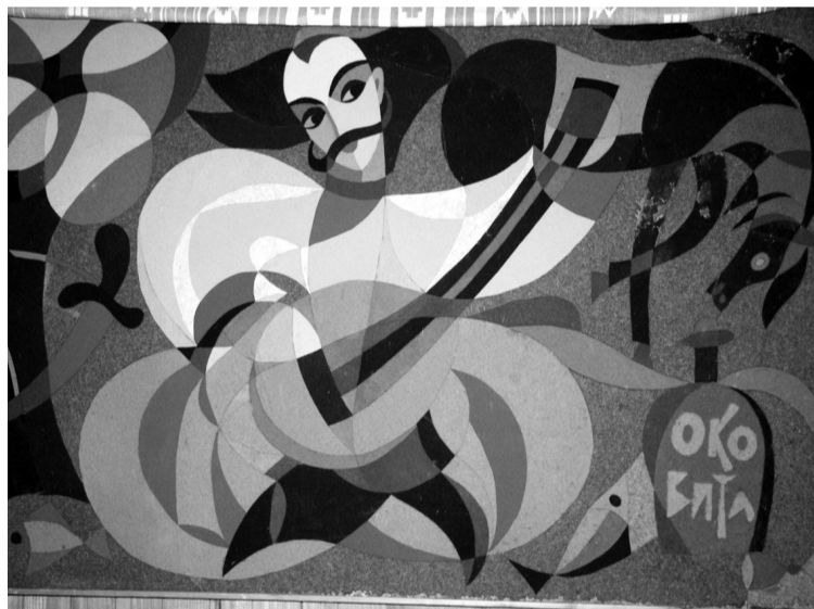
Один із знаменитих колажів майстрині.