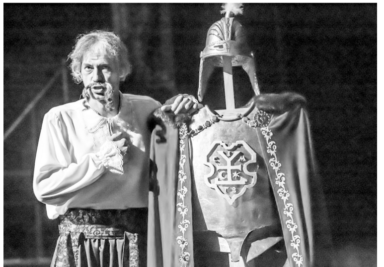
Опера «Мазепа».

в рамках мистецького проекту «Гетьман України Іван Мазепа». Його частиною є і відкриття 22 липня пам'ятника видатному українцю в районі Колмак Харківської області, де 330 років тому Мазепу обрали гетьманом. (Над образом працював народний художник України Сейфаддін Гурбанов). У Коломаку присутнім просто неба показали й оперу «Мазепа». ■