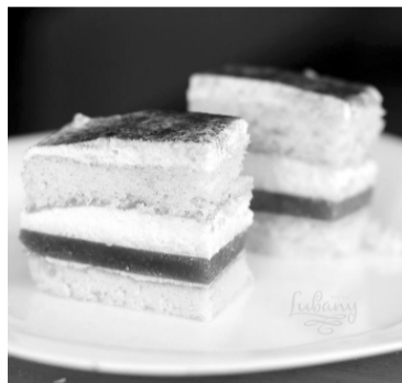
Торт, від якого не відмовляється ласуни.

том, деякі знаходять радість у бучних вечірках. Ми з чоловіком завжди цікавилися кулінарією: спочатку займалися для себе (купували кухонну техніку та знаряддя, шукали цікаві рецепти, готували нові страви), потім захотілося поділитися своїми здобутками з іншими, і ми почали вести кулінарний блог. Йому вже 8-й рік».