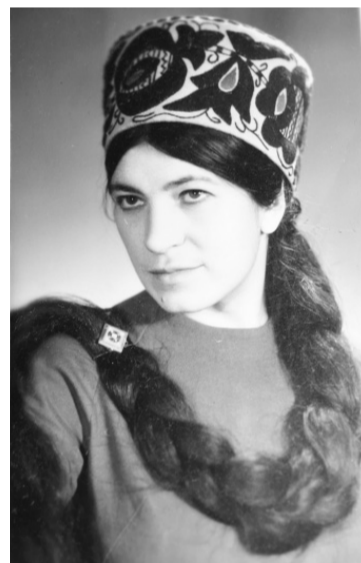
Знаменита довга коса художниці.

ки фарби, то так за це «вишколювали», довго згадуючи, як вони багато грошей на мене потратили. Тому, навчаючись у ВУЗі, я не струшувала ніколи фарби з пензлика, а брала стільки, скільки треба для малювання. Одногрупники дивились на мене, як на білу ворону.