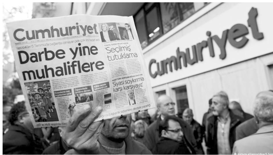
У рейтингу свободи преси організації «Репортери без кордонів» Туреччина нині посідає 151-ше місце зі 180.

Чим Генпрокуратура обґрунтовує свої закиди, можна здогадатися зі справи Ахмета Сіка. Журналіст-розслідувача було взято під варту наприкінці грудня 2016 року. Генпрокуратура спирається на повідомлення, які Сік по-