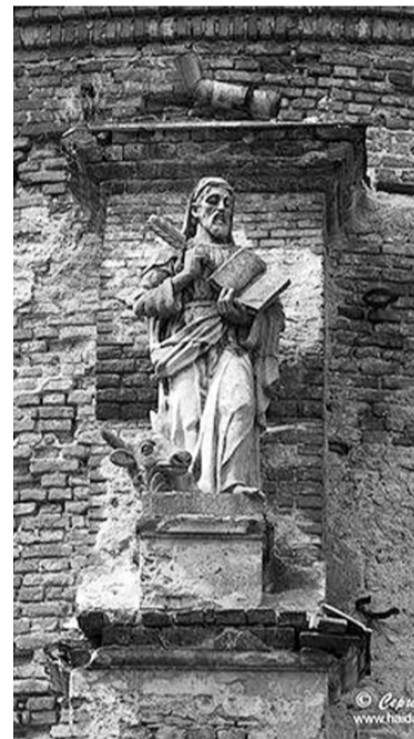
Скульптура апостола Луки у селищі Стара Сіль.

Найближче від дороги — головний масив, пристосований за незапам'ятних часів для оборонних цілей. У прямовисних стінах — видовбані печери правильних обрисів. Над однією з них, на другій ярусі, добре видно сліди примикання двосхилого даху. Розтинають масив вузькі похмурі щілино-подібні ущелини. В одній із них збереглися фрагменти кладки і склепіння. Перед масивом — обнесений валом чималий майданчик. На ньому, як правило, людно, йде торгівля сувенірами, продуктами. Бажаючих катають на конях.