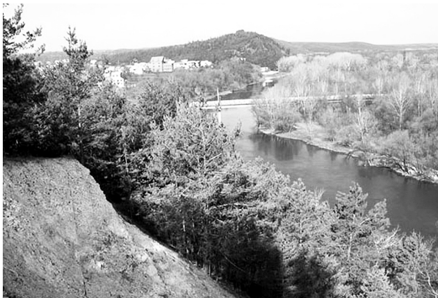
Крейдяні бори сформовані сосною крейдяною — третинним реліктом, занесеним до Червоної книги України, — зараз збереглися лише на окремих ділянках біля Святогірського монастиря.

Під час семінару українські фахівці ознайомилися з досвідом Німеччини стосовно інвентаризаційного опису, оцінки та оприлюднення