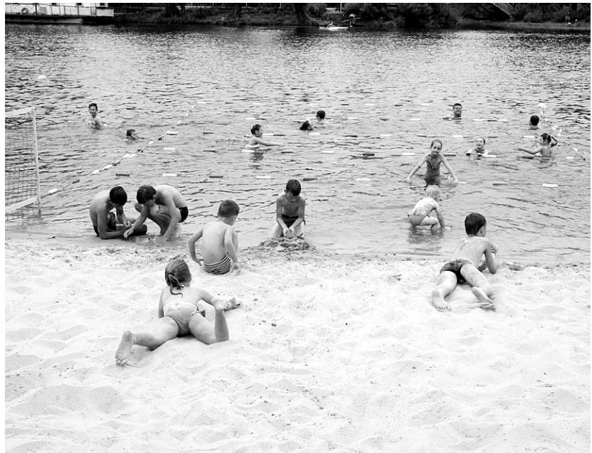
На дитячому пляжі в Гідропарку відкрився «Клуб дитячого плавання».

За підтримки Радикальної партії в столичному Гідропарку відкрився щорічний безкоштовний «Клуб дитячого плавання»