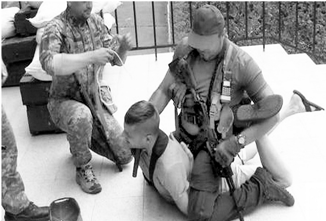
Участь телевізійника у ролі провокатора під час інсценування спершу сприймалася ефектно.