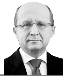
Андріус Кубілюс екс-прем'єр Литви

«Ми дійшли висновку, що головна мета Путіна — це не дозволити Україні стати успішною державою, тому що успіх України для режиму Путіна є великою небезпекою».