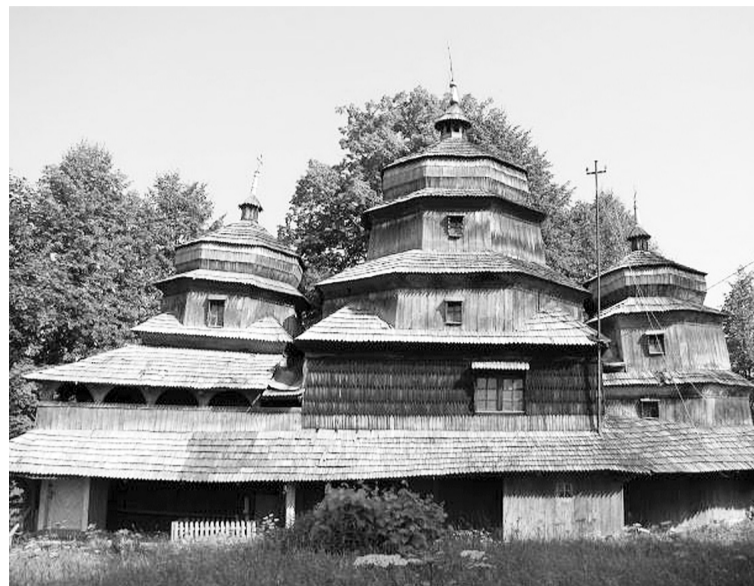
Село Ісаї. Михайлівська церква.