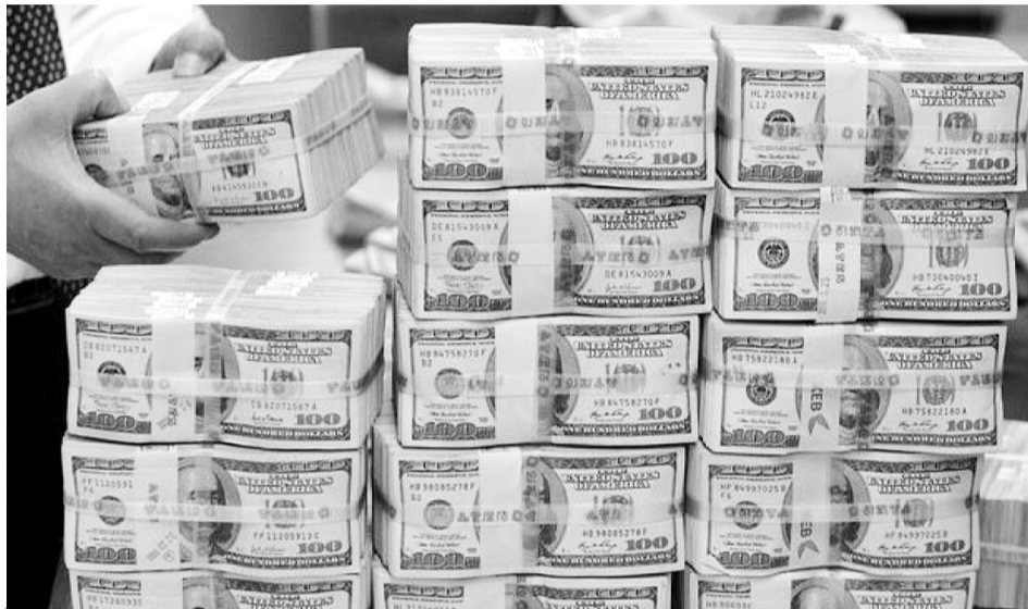
В Україну готові інвестувати як у лінію оборони від путінської Росії. Чи готова наша держава відповідати всім покладенням на неї очікуванням?

Нове кредитування України поки ще навіть не пообіцяли. Щоб отримати вагому фінансову підтримку, урядовці мають довести гарантовано ефективне її застосування