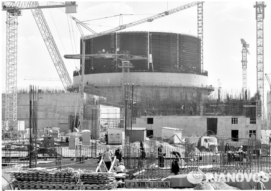
Білоруська АЕС зводиться поблизу міста Островець.

Президент Білорусі Лукашенко сказав, що влада країни надає великої ваги будівництву атомної електростанції: «Я в усіх деталях знаю будівництво атомної електростанції і перебіг цього процесу. Крім цього, постійно зустрічаючись із президентом Росії, ми на кожній зустрічі обговорюємо будівництво атомної станції», — підкреслив Лукашенко. Президент Білорусі каже, що його країні, яка постраждала від чорнобильської катастрофи, нелегко було прийняти рішення про будівництво атомної електростанції. Однак переконали суспільство до цієї інвестиції вдалося, оскільки це — майбутнє