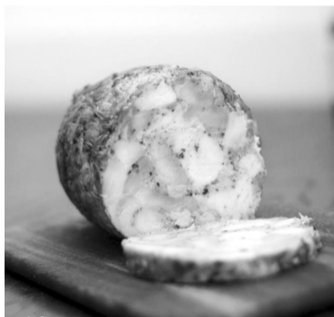
Смачний рулет.

«У кожної молоді сім'ї свої пріоритети. Одні люблять подорожі, інші захоплюються спор-