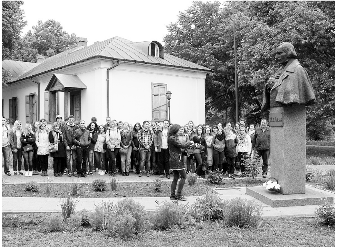
Гоголівська акція, проведена путінським фондом «Русский мир» на Полтавщині у травні 2017-го.

У тому, що керівники таких ось російських культурних центрів в Україні (і не тільки) є солдатами «русского міра», сумнівів уже немає. Доказів не завжди вистачає. Та, нишпорячи у світовому павутинні, комп'ютер днями видав на-гора сюрприз, якого не чекала: на сайті з логотипом благодійного фонду «Русский мир» читаю: «Волынская область. Общественная организация «Русский культурный центр». Руководитель — Саган Ольга Георгиевна. Адрес, телефон». Це той самий фонд, 10-річчя створення якого урочисто святкували в Росії цього літа. Він заснований був на виконання указу Президента РФ Володимира Путіна від 21 червня 2007 року. Це той фонд, під патронатом якого сотні таких «культурних російських центрів», як у Луцьку, діють по всьому світу. На сайті навіть карта є, де вони працюють. Найрясніше всіяна ними Європа і ті країни, в яких проросійські настрої домінують, що є закономірним. Нещодавно Путін