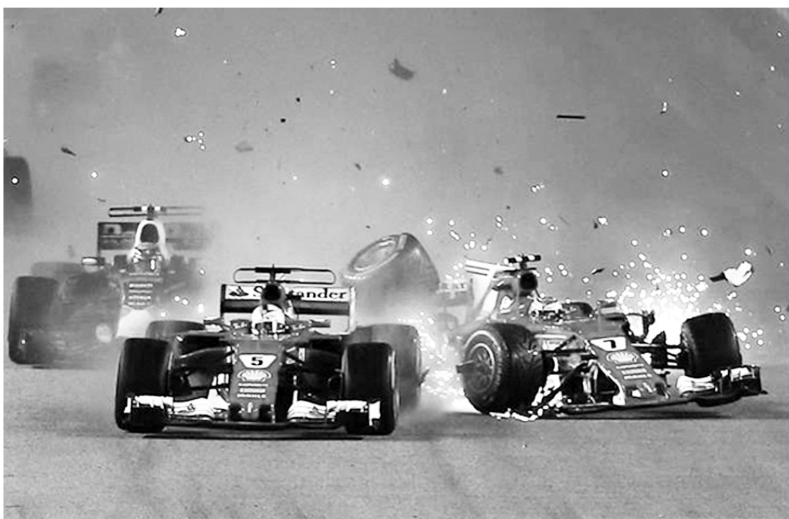
Уже на старті Гран-прі Сінгапуру обидва боліди «Феррарі» зійшли з дистанції.

Попри провал у Сінгапурі у «Феррарі» обіцяють не виходити з чемпіонських перегонів