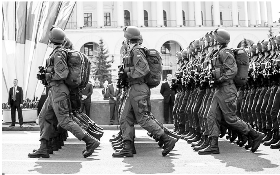
Найлогічніший крок авторів Держбюджету-2018 — суттєве підвищення витрат на українську армію

«Перший трильйон», за планами уряду, в 2018 році ми отримаємо завдяки зростанню ВВП на 3%. Цифра є трохи завищеною від підрахунків вітчизняних аналіти-