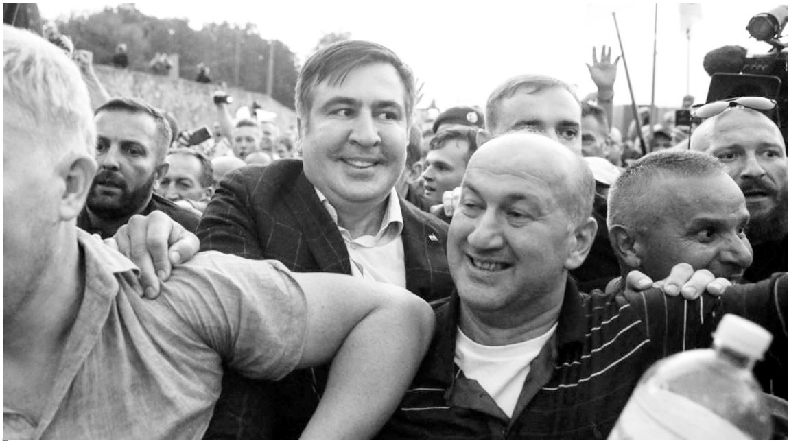
Ще одні «чемні люди»...

Належної правової оцінки та судових рішень заслуговують усі учасники порушення державного кордону України на чолі з Саакашвілі