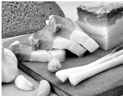
Сало — дорогий делікатес.

сало в Україні подорожчало на 49,6 відсотка, свинина — на 45,3, курятина — на 35,8, яловичина — на 33,2 відсотка.