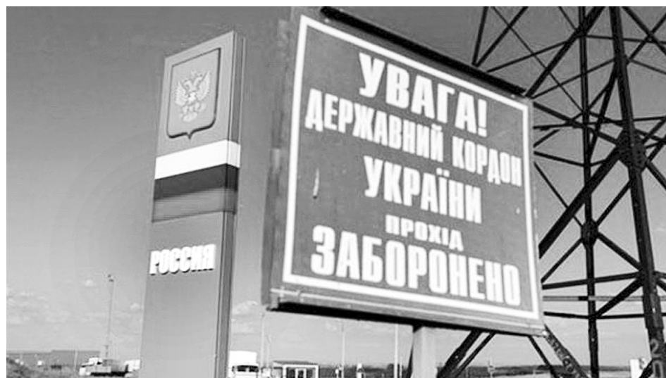
Україна має захищатися від Росії усіма доступними їй способами. Один із них — впровадження візового режиму з агресором.

Чи вдасться Україні контролювати потік росіян, які бажують в'їхати до нашої держави?