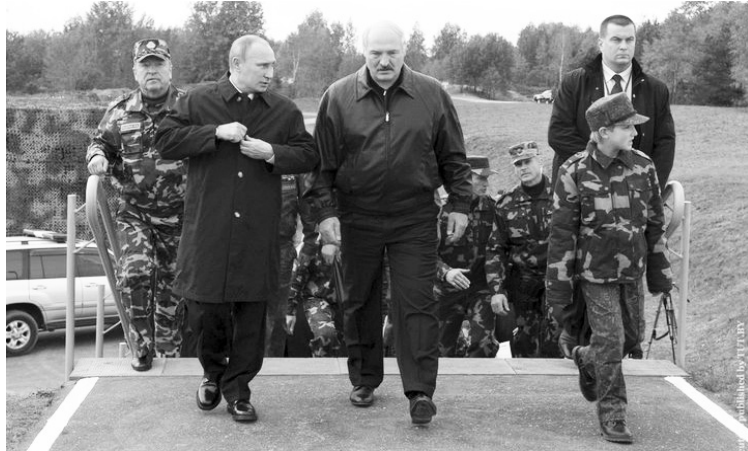
Путін і Лукашенко: цього разу чомусь не разом.

Та чи всі російські військові повернуться додому? Раніше експерти вже висловлювали побою-