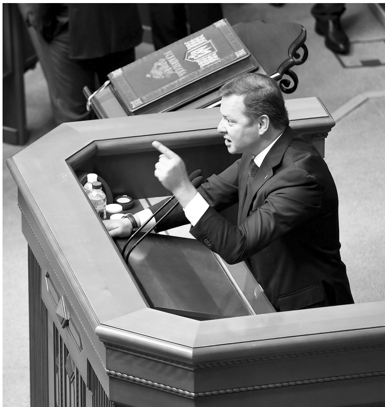
Олег Ляшко пропонує альтернативу економічній політиці влади.

Ми запропонували чіткі системні рецепти подолання цих викликів. І, навіть перебуваючи в опозиції, щоденно працюємо над реалізацією цих рецептів.