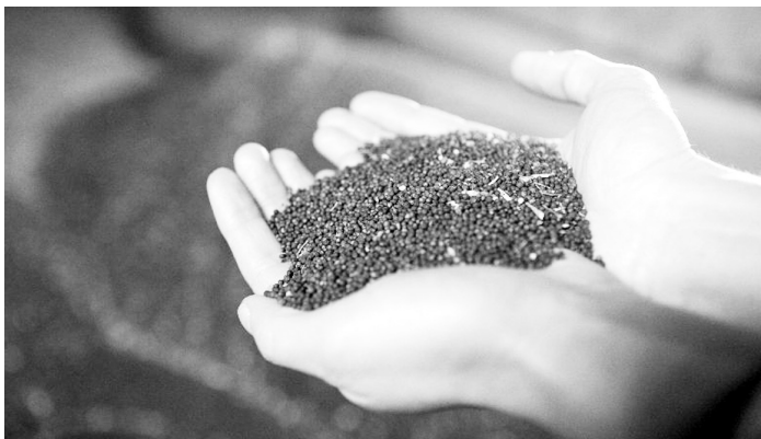
Озима посівна ріпаку вже завершується.

У перші тижні осені майже завершено посів озимого ріпаку