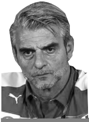
Мауріціо Арривабене керівник команди «Ф-1» — «Феррарі»

«Неймовірно прикра ситуація й зовсім не той результат, на який ми розраховували. Утім це не означає, що боротьба завершена. Просто в боротьбі за чемпіонство значно складніше. Шкода вболівальників, але ми спробуємо реабілітуватися».