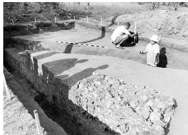
Козацьке поховання XVII століття у Чигирині: істориком є над чим поміркувати.

Як припускають археологи та історики, ці черепи, ймовірно, належали захисникам Чигирини, які у 1677-му цілий рік захищали місто від навали турків. На місці знахідки, пояснюють працівники Чигиринського заповідника, як свідчать історичні фак-