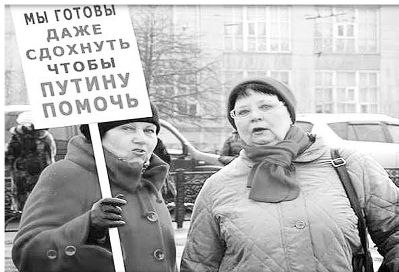
Вони готові терпіти будь-що, аби нести в маси свій «русский мир»

«Широкий російській душі» завжди було тісно у межах будь-яких кордонів, Московія розширювалася, захоплюючи Новгород, Казань, Астрахань, Сибір, прибалтійські землі, Україну, Польщу, Кавказ, Туркестан. Від XV до XX століття Росія збільшила свою територію в 57 разів. «За 234 роки (з 1228 р.) Московщина мала 160 війн. Це були загарбницькі війни, і лише 4 — оборонні» (П. Штепа «Московство», 1968). Лише за останні 75 років Москва відкусила частину маленької Фінляндії, острови у малій Японії, привласнила Кьонінгсберг із областю. (Люди у пограбованих країнах живуть набагато краще, ніж у Росії, бо для росіян головне — захопити територію, у