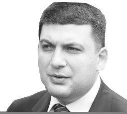
Володимир Гройсман Прем'єр-міністр України

«Усі, хто винен у загибелі дітей в Одесі, мають понести жорстке покарання, назалежно від посад. Масмо всі зробити висновки з трагедії. Халатність, безвідповідальність, а особливо, якщо в їх основі — корупція, не можуть мати жодних виправдань!».