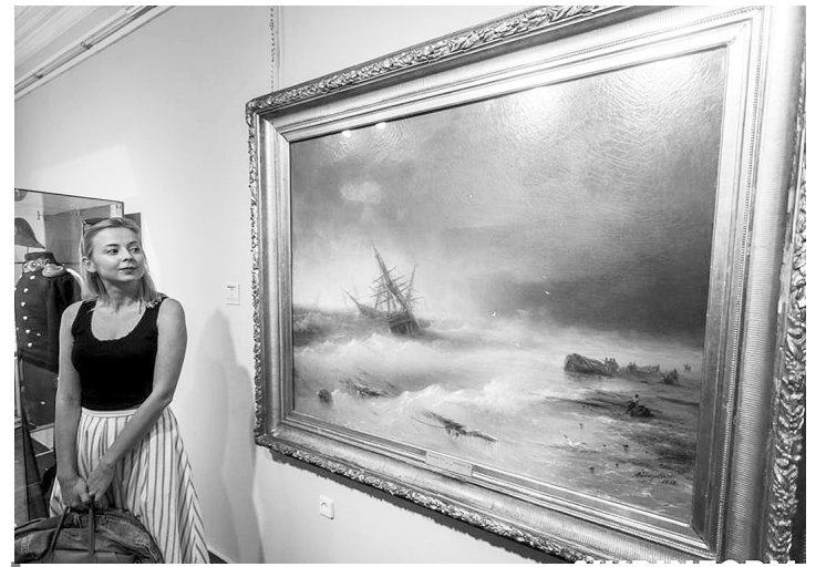
«Буря» (1872) Івана Айвазовського.

У Київській картинній галереї показують роботи Івана Айвазовського