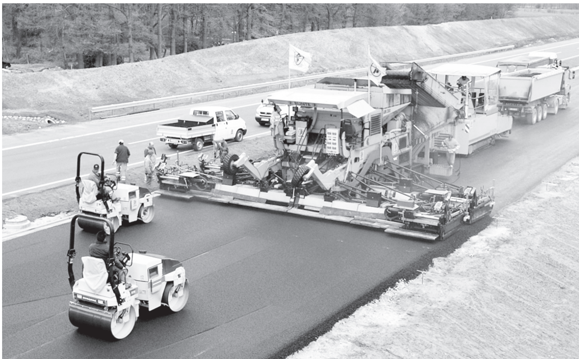
Проект Держбюджету-2018 передбачає рекордні обсяги фінансування будівництва та ремонту доріг. Але «пощастить» не всім магістралям.