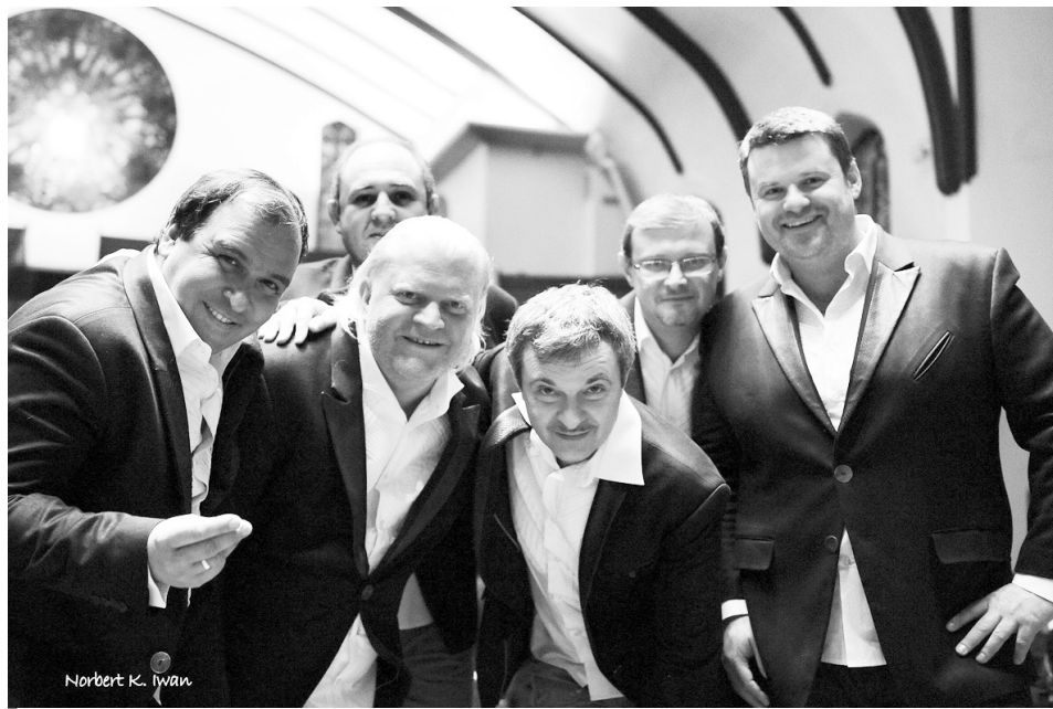
«Пікардійська терція».

ких народних пісень. Чому виокремили саме цю?