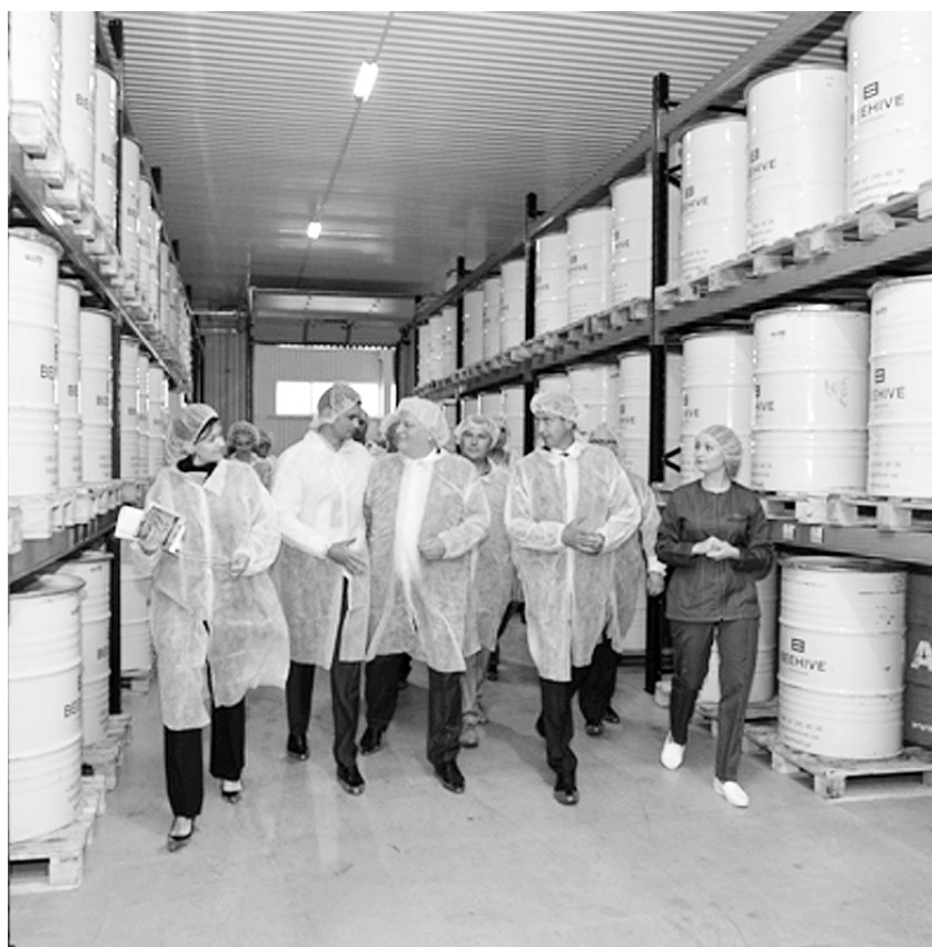
Стільки меду можна побачити тільки на заводі.

На Черкащині запрацював завод, що вироблятиме цілющий продукт