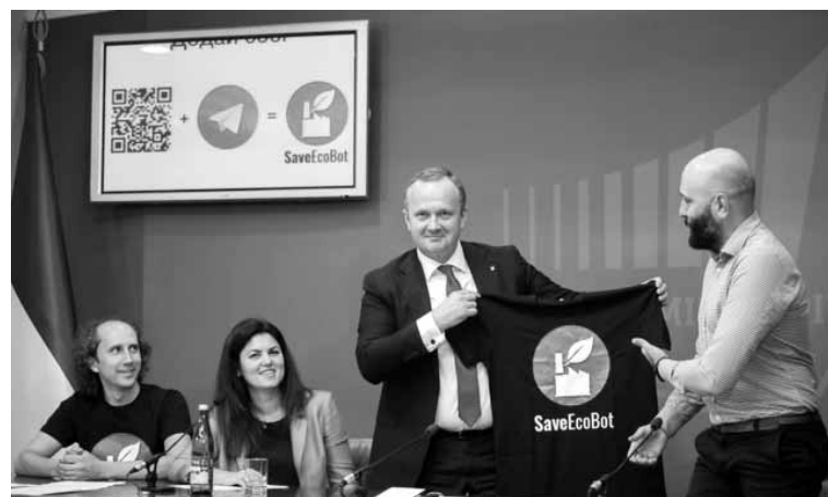
Волонтерити в державних інтересах екоактивісти ніколи не припиняють.

го скорочення зелених зон, в Україні було ухвалено досить дивний Закон «Про мораторій на зміну цільового призначення окремих земельних ділянок рекреаційного призначення в містах та інших населених пунктах» від 17 березня 2011 року N 3159-VI, — коментує ситуацію директор Інституту громадянського суспільства. — Ним встановлено заборону на зміну цільового призначення земель рекреаційного призначення в містах та інших населених пунктах, а саме: земельних ділянок зелених зон і зелених насаджень та земельних ділянок об'єктів фізичної культури і спорту. На наш погляд, цей закон не виправдав свого призначення і за своїм змістом виглядає досить обмеженим та сумнівним із точки зору корисності для місцевого та регіонального розвитку. ■