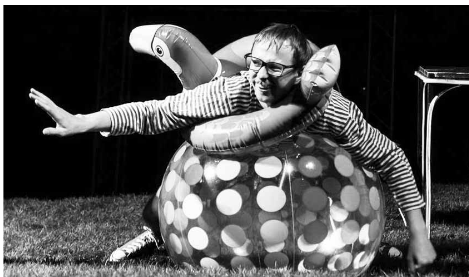
На сцені проекту актором став і телеведучий Майкл Щур.

Чому я так сильно люблю це? Три причини: це про історії; це про молоді; це про трансформаційну силу театру. Ми всі знаємо, що історії, які ми розповімо про себе та про інших людей, є потужними механізмами — вони мо-