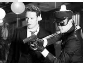
01.05Х/ф «Судна ніч» 02.35 Т/с «Морська поліція. Новий Орлеан» 03.20 Т/с «Винищувачі» 04.10 Провокатор

05.05, 12.45 Факти 05.30 Стоп-10 07.25 Т/с «Невиправні» 09.20 Т/с «Відділ 44» 12.15 «На трьох» 13.00Х/ф «Дикий, дикий Вест» 15.00Х/ф «Електро» 16.55Х/ф «Еон Флакс» 18.45 Факти тижня. 100 хвилин 20.35Х/ф «Еквілібріум» 22.50Х/ф «Зелений шершень» 01.05Х/ф «Судна ніч» 02.35 Т/с «Морська поліція. Новий Орлеан» 03.20 Т/с «Винищувачі» 04.10 Провокатор 20.00 Запрограмовані долі 00.00 Чужинці всередині нас 00.50 Місця сили