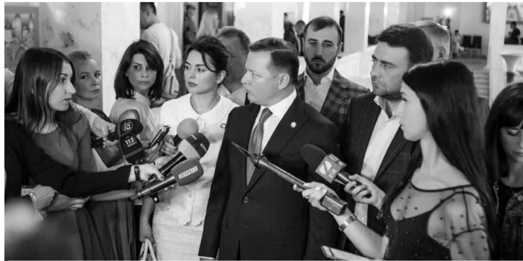
Ляшко попередив і своїх депутатів: якщо когось зловлять п'яним за кермом — «відмазувати» нікого не буде.

Ляшко добився, щоб у п'яних водіїв забирали права назавжди