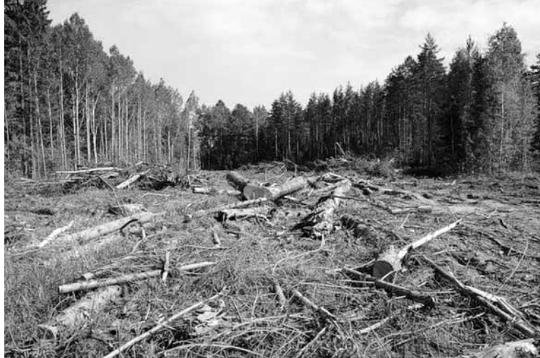
Сподіватимемося, що до кінці року несанкціонованого лісопалу в геометричній прогресії не збільшиться.

Згідно з документом, обсяг внутрішнього споживання вітчизняних необроблених лісоматеріалів не повинен перевищувати 25 мільйонів кубометрів на рік незалежно від обсягу внутрішнього споживання лісоматеріалів у попередньому році. Законом у Кримінальному кодексі України встановлюється, що переміщення через митний кордон поза митним контролем лісоматеріалів або пилосированих цінних та рідкісних порід дерев, а також лісоматеріалів, заборонених до вивезення за межі митної