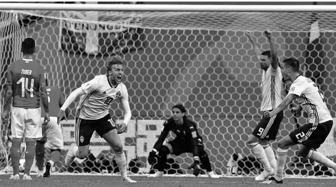
Пропустивши два попередні «мундіалі», на ЧС-2018 збірна Швеції без своєї головної зірки Златана Ібрагімовича пробилася до чвертьфіналу.

На чемпіонаті світу-2018 залишилося лише три з десяти перших збірних рейтингу ФІФА