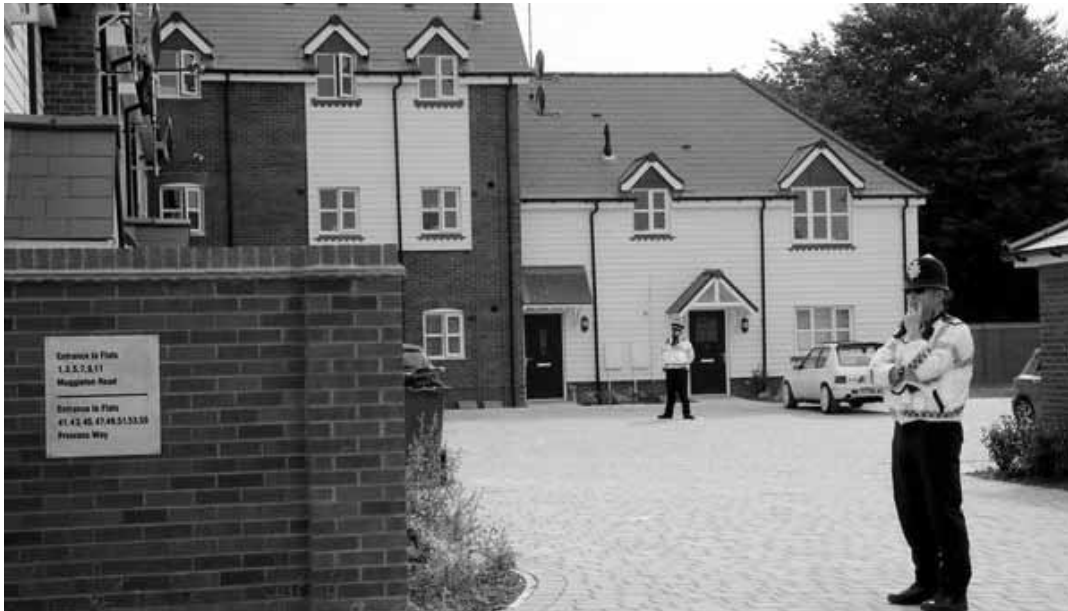
Поліція перед будинком, де сталось отруєння.

Чергова пара отруєна нервово-паралітичною речовиною в Англії