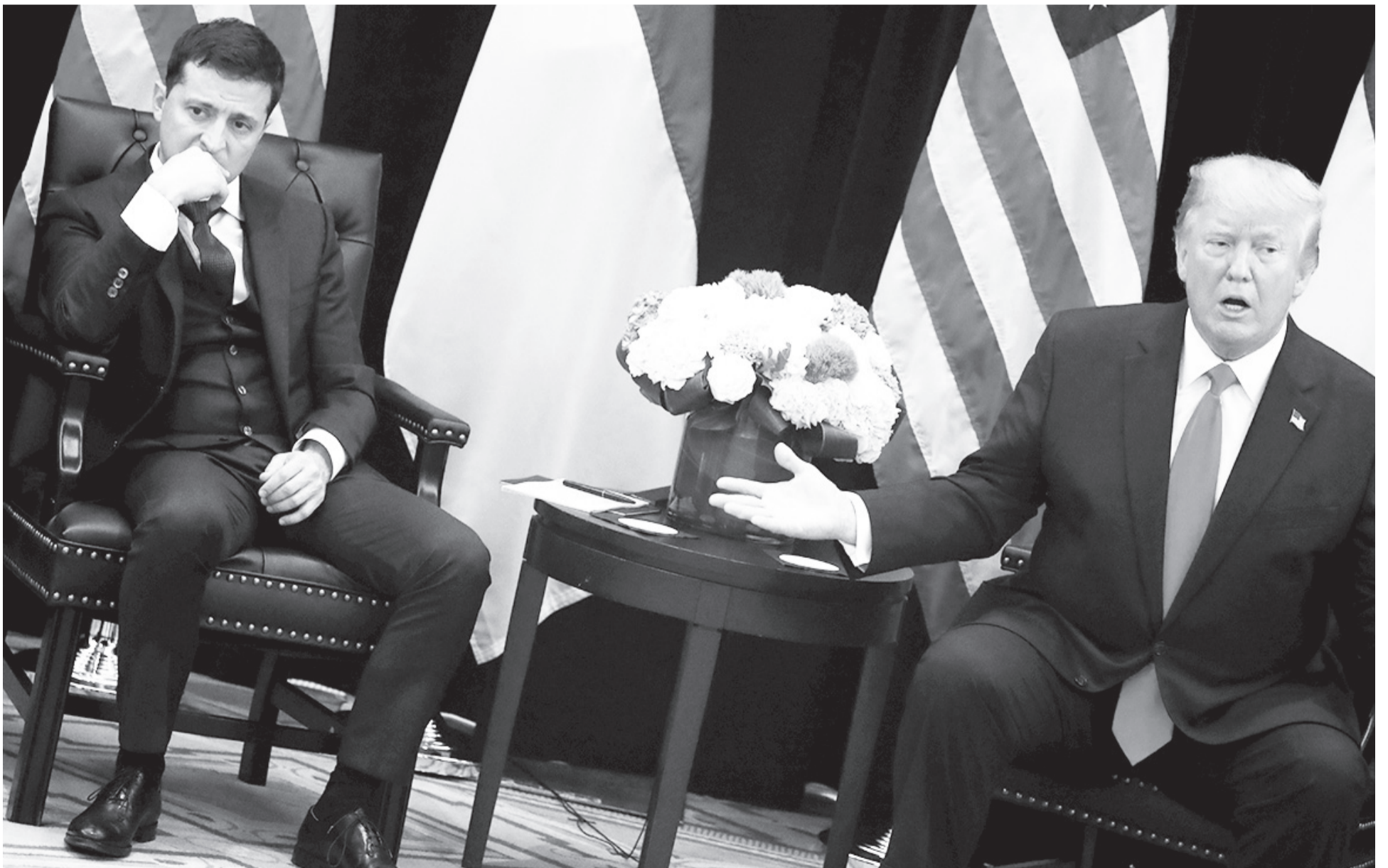
Розмова була «дружня і доречна», вважають у Білому домі.