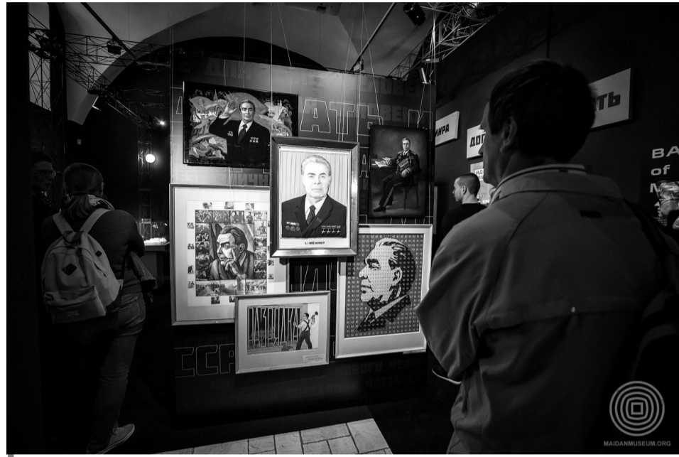
Період «дорогого Леоніда Ілліча» вважають «найромантичнішим» з усієї епохи «совка».

«Ми хочемо, щоб люди відчули, наскільки всепроникним був «совок», наскільки він пронизував кожен сферу життя людини і перетворював вільних особистостей на таких, які були зручні системі», — розповідає куратор виставки, співробітниця Українського інститу-