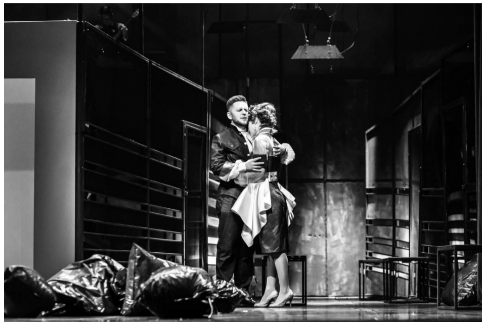
Сезон Київська опера відкрила еротичним трилером «Весілля Фігаро».

— Саме так. Хотілося відійти від поверхневого шаблонного сприйняття цих героїв. У цьому і дивність постановки, че-