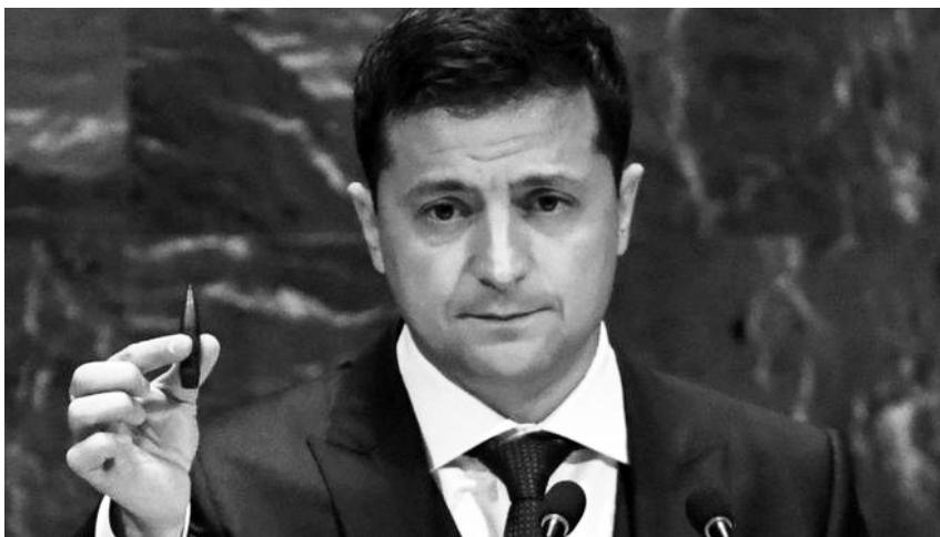
Володимир Зеленський: вартість людського життя сьогодні дорівнює вартості цієї кулі.

«Я розповім вам одну історію. Історію людини, для якої «бути почутим» стало сенсом життя, — зазначив Зеленський. — Адже цей чоловік мав божественний голос. Його називали одним із найкращих баритонів і контратенорів світу. Його голос звучав у Карнегі-холі в Нью-Йорку, соборі Нотр-Дам, лондонському Ковент-Гардені та Гранд-Опера у Парижі. Кожен із вас міг би особисто почути його неймовірний спів. Але, на жаль, є річ, яка не дозволить вам цього зробити. Вона виглядає — зараз я вам покажу — ось так. 12,7 міліметра, які не просто зупинили його кар'єру. Вони зупинили його життя. Ось це коштує 10 доларів. І, на жаль, сьогодні на нашій планеті це — вартість людського життя.