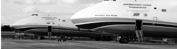
Коли є вільний час між польотами, «Руслани» відпочивають удома.

Надважкі вантажі надихають «Авіалінії Антонова»