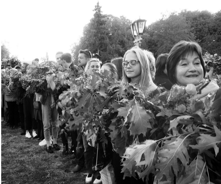
На рекордний вінок-оберіг пішло кілька тонн квітів, трав та гілочок дерев.

У Полтаві створили рекордний вінок-оберіг завдовжки понад кілометр