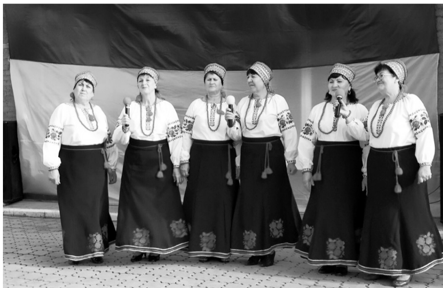
Ансамбль «Бир Тайфа».

На святі, як годиться, і щиро від душі співали, і щедро до дірки в гаманці ярмаркували. Зокрема, вправні майстрині з декількох навколишніх сіл представили на розсуд тутешньої грекотатарської публіки різноманітні національні оздоблення й нагрудну вишивку (гердани). Натомість місцеві пекарі й кулінари, у свою чергу, залюбки майже поруч змагалися у вмінні спокусливо і смаковито пригощати численних прибулих гостей. Які (ну й, ясна річ, на пару з автором цих рядків) по-братерськи, без огляду на наципринципальність, досхочу насолоджувалися справжніми баранячими чирчирями (чебуреками), запиваючи їх кисломолочним ар'яном. Тут принагідно слід було б, либонь, уточнити, що найперші переселенці з півострова (яких — нагадаємо — справдила сюди ще «обуяна добрими намірами» цариця Катерина разом зі своїм коханим і всесильним фаворитом Грицьком Потьомкіним) міцних хмільних напоїв зовсім не вживали — навіть попри досконало розвинені в них виноградарські традиції. Тобто якихось безнадійних п'яниць чи бомжів у грекотатарському середовищі майже ніколи не спостері-