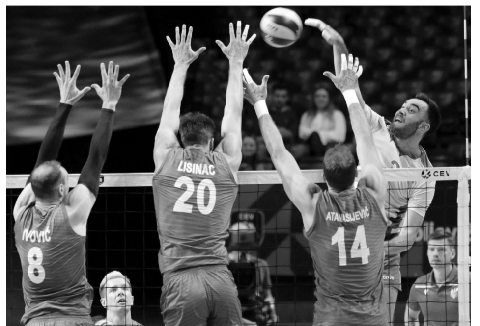
У чвертьфіналі ЧЄ-2019 українські волейболісти на рівних боролися з бронзовим призером попереднього єврофоруму.

«Хлопці проявили себе з найкращого боку. Можу сказати, що пишаюся своєю командою, атмосферою і тією роботою, котру ми виконали. Перед стартом турніру розраховувати на