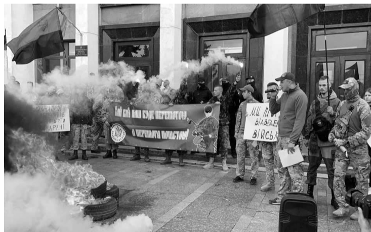
Цього разу символ майданівських протестів громадянського суспільства взяли на озброєння в Тернополі.

В акції взяли участь представники ветеранських організацій Тернополя та області й місцевих націоналістичних організацій. Вони прийняли відповідне офіційне звернен-