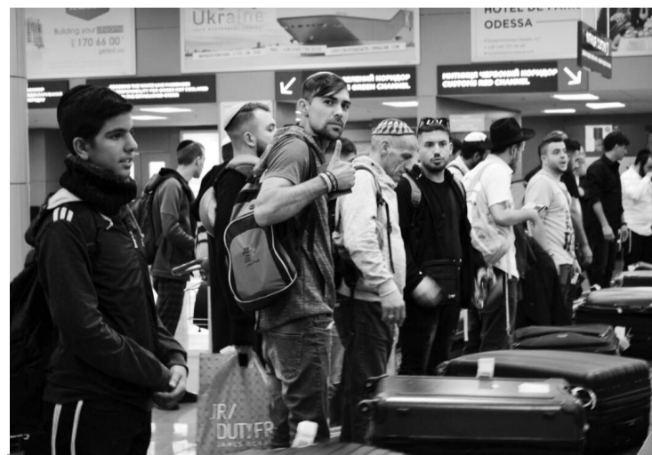
Прикордонна служба передає естафету супроводу щорічного святкування іудейського нового року в Умані місцевим правоохоронцям.

Принагідно зазначається, що від початку прибуття хасидів (з 6 вересня) співробітники Держприкордонслужби через кордон не пропустили чотирьох громадян Ізраїлю через відсутність необхідних документів та заборону в'їзду в Україну ще під час попереднього візиту. Бо траплялися конфліктні ситуації, що вини-