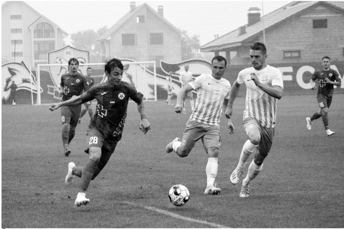
Зухвалий новачок першої ліги — ужгородський «Минай» — вивиб із розіграшу Кубка луцьку «Волинь».

Фіналіст попереднього кубкового турніру з першої ліги й надалі продовжує дивувати більш іменитих опонентів своєю непоступливістю