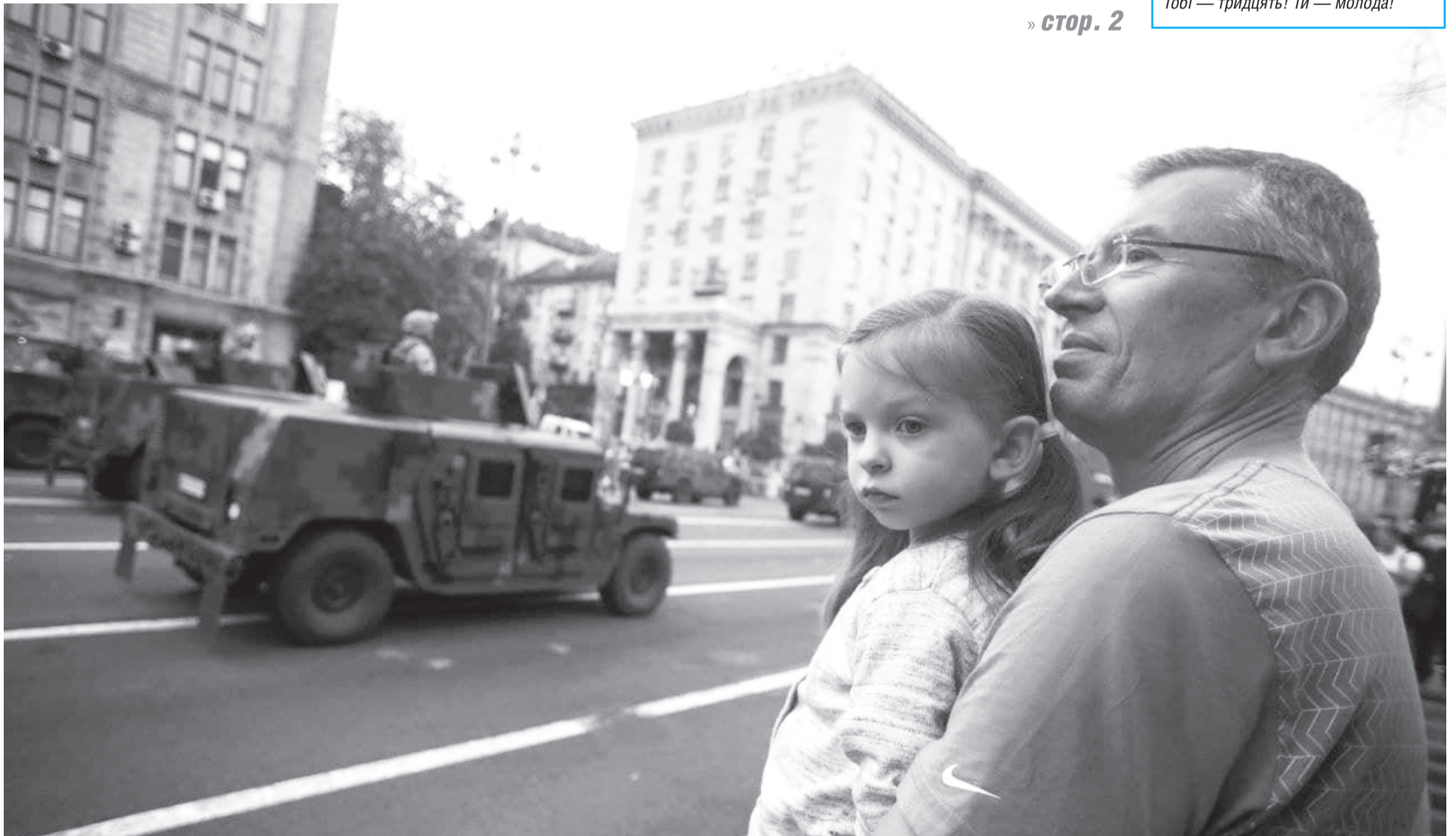
Репетиція святкового параду.

Поставала наша держава Серед різних епох і ер: Русь велична часів Ярослава, Романтичні часи УНР... Мали ми і вождів, і пророків, І невдовзі натхненно ми Всі відзначимо тридцять років Свого виходу із пітьми. Хоч ми мали пристойну владу Десять років із тридцяти, Хай минуле скиглить позаду. Наша справа — вперед іти! Вже й підтримку, і зраду пізнавши, Визначаємо шлях свій самі І це свято все-таки наше, А не тих, котрі при кермі! Твоя доля трагічна й велична. Є в ній радість, і є біда. Україно! Вітчизно вічна! Тобі — тридцять! Ти — молода!