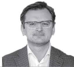
Дмитро Кулеба глава МЗС України

«23 серпня засновниками «Кримської платформи» стануть 44 держави та міжнародні організації. Це 14 глав держав, урядів та ЄС. На рівні президентів будуть представлені Латвія, Литва, Естонія, Польща, Словаччина, Угорщина, Молдова, Словенія, Фінляндія, а також президент Євросоюзу. Отже, разом з Україною — 45 учасників».