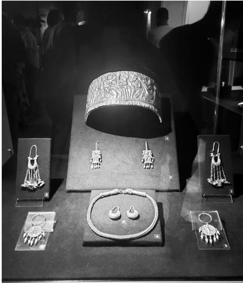
Виставка «Скіфське золото».

«Перші скіфські пам'ятки, знайдені в українській землі, були вивезені з України. Друга хвиля