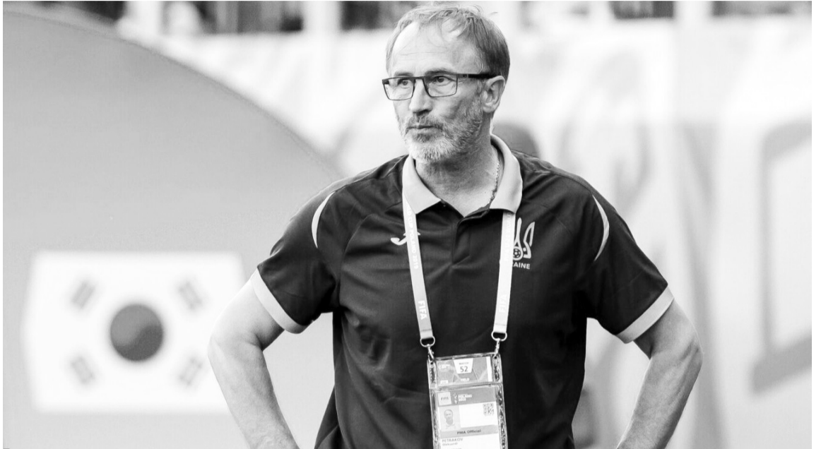
Олександра Петракова призначили новим керманічем першої футбольної збірної України.

До подальших виступів у відборі на ЧС-2022 збірну України готуватиме Олександр Петраков