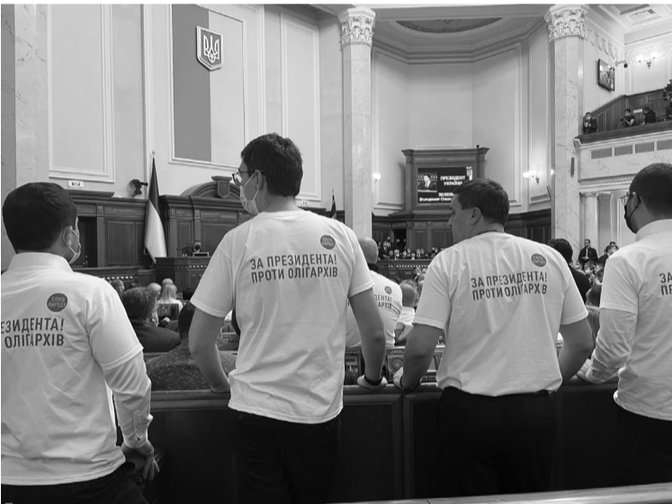
«Слуги» в однакових футболках надійно перекривали опонентам доступ до президента.