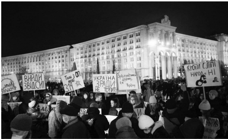
Мирна акція проти бездіяльності влади «Захисти Україну — зупини переворот».

ти і про це говорити, то давайте нічого не робити», — сказав Зеленський під куполом Ради.