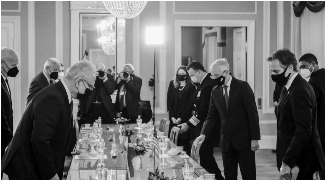
Міністри закордонних справ НАТО зустрілися, щоб обговорити, як протидіяти Росії.

У Ризі відбулося засідання НАТО з питання захисту України від російської загрози