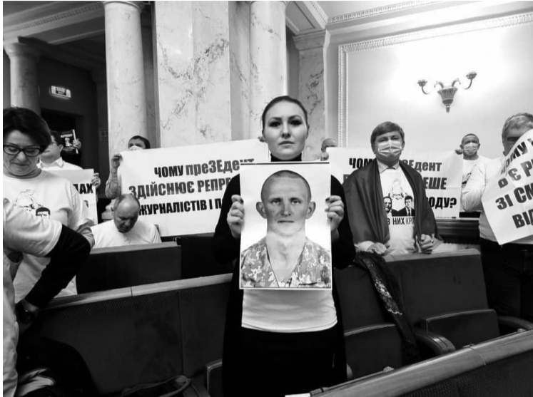
Опозиція звернулася з питаннями до Зеленського за допомогою плакатів.

«Ми повинні сказати правду. Ми не зможемо зупинити війну без прямих переговорів із Росією, і наразі це визнали всі. Всі зовнішні партнери, а деякі внутрішні це не визнають. Ми повинні говорити, знаючи, що у нас сильна потужна армія, і не боятися зараз говорити один одному правду. Якщо ми хочемо повернути Донбас, то давайте, а якщо хочемо просто ходи-