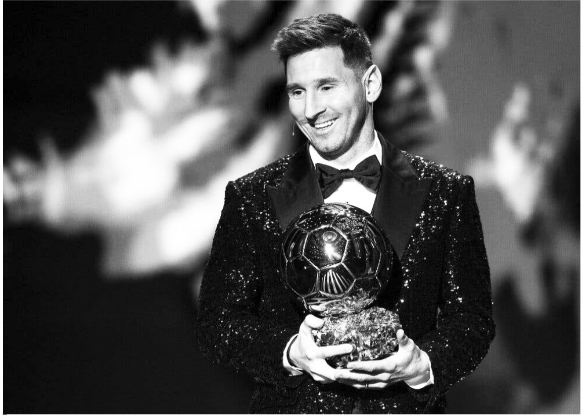
Ліонель Мессі всьоме отримав «Золотий м'яч».

Зрештою, після хвилі негативних коментарів у засобах масової інформації активно