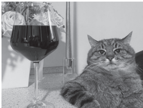
Істина — у вині.

Своє справжнє ім'я дівчина й досі приховує, оскільки, на відміну від свого пухнастика, не лю-