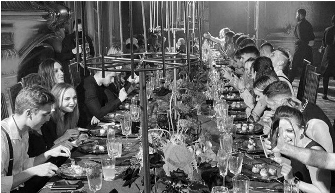
Юні блогери не можуть зрозуміти, чому Володимир Зеленський із жартами про «Синьйора-Голодомора» — це дотепно, а за «Голодну тусу» карають гривнею...

Організатори БДСМ-вечірки на День пам'яті Голодомору вважають винними в цьому... українські ЗМІ, які надто мало розповідають про трагічні дати вітчизняної історії