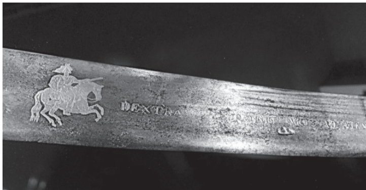
Шабля та монети й медалі із зображенням польського короля Яна III Собеського.

були два загони руської шляхти, яка у Львові об'єдналася з польською шляхтою. Далі — похід у напрямку Варшави і на Відень. Там у вересні 1683 року війська Собеського розбили турків. І за цей подвиг імператор наказав виготовити оцю шаблю», — розповів Олег Гаврилук історію старовинного збройного раритету, який дотепер десятиліттями зберігався у музейному сховищі. Королівську шаблю розмістили у ніші під бронзованим склом разом з медалями і монетами із зображенням Яна III Собеського, відтак планують облаштувати окрему експозицію, що відобразить роль цього польського короля українського походження у захисті східних кордонів тодішньої Європи.