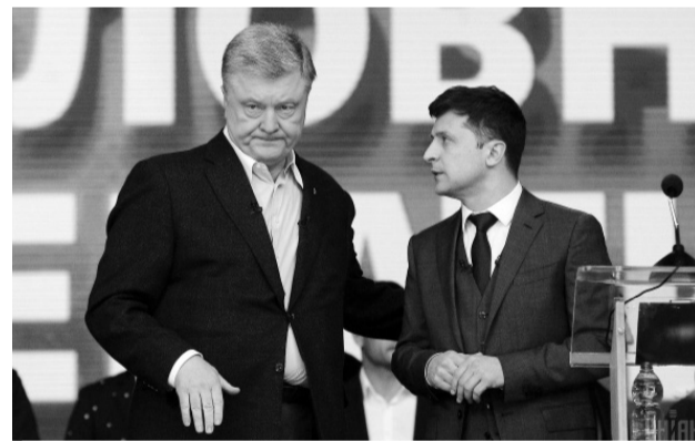
Порошенко Зеленському: Ну-ну, подивимось...

Однак ще два місяці тому, у вересні, досліджен-