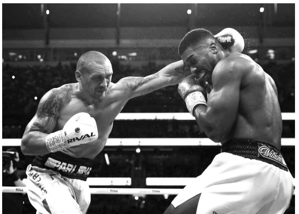
Олександр Усик відібрав три чемпіонські пояси у Ентоні Джошуа й готовий до об'єднавчого бою з іншим британцем — Тайсоном Ф'юрі.

До слова, іншого кривдника Кличка-молодшого — Ентоні Джошуа — Олександр Усик уже переміг. Тепер на чер-