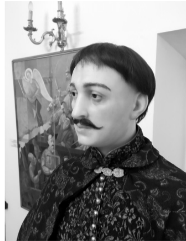
Дем'ян Ігнатович, Петро Дорошенко, Іван Брюховецький (воскові образи).

Якщо ми відкриємо будь-який підручник історії Української РСР, то першим, що кинеться в очі, буде навіть не ідеологічна спрямованість, а величезні розриви в хронології. Тут тільки-но сталася монгольська навала і західні сусіди «пригнобили» українські землі, як почалися повстання проти гнобителів у кінці XVI століття. 300 років — п'ять-шість епізодів! Після 1654 року, після Переяславської ради, історія України взагалі зникає — залишається тільки «участь у формуванні загальноросійського ринку» та кілька «зрад гетьманів». А що дивного? «Віковичну мрію про возз'єднання» реалізували, яка далі може бути історія України?