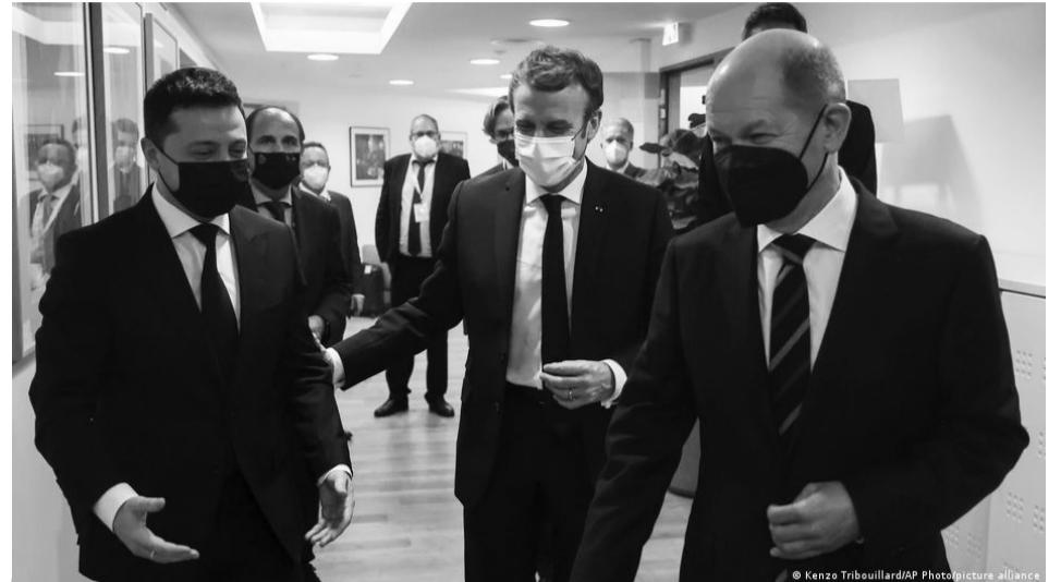
Володимир Зеленський «усував непорозуміння» в Брюсселі.

Це будуть грантові гроші, які виділять до 2027 року. Ці 2,3 мільярда будуть розділені на дві частини. У рамках першої для кожної країни будуть передбачені чіткі обсяги фінансування. За другу ж частину країнам «Східного партнерства» доведеться позмагатися, адже кошти виділятимуть передусім на найкраще підготовані проекти. Єврокомісія запропонує по п'ять флагманських проектів для кожної з шести країн. В Україні