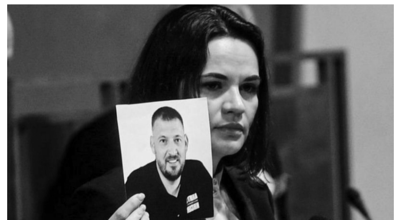
Після арешту Сергія Тихановського його дружина Світлана висунула свою кандидатуру на виборах президента Білорусі.

«Слухайте, а мені наплювати на те, що в Євросоюзі ви думаєте про президента Білорусі, — заявив в ексклюзивному інтерв'ю Бі-Бі-Сі 21 листопада цього року Олександр Лукашенко. — Мене обирали не Єв-