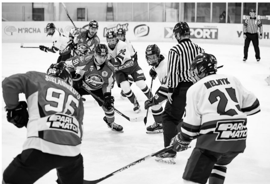
Керівництво ФХУ новостворену хокейну суперлігу називає «аматорським» турніром.

яснити відсутність уваги до клубів суперліги, новостворені змагання назвали «аматорськими» й одразу спробували розставити всі крапки над «і» в питанні статусу того турніру.