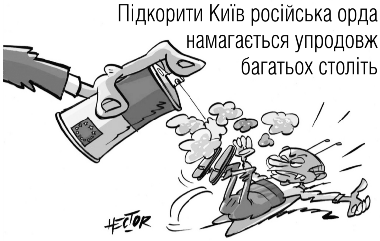
Карикатура ілюстратора з Франції Режиса Ектора (Regis Hector).

І є підстави погодитись із прискіпливим дослідником душі москвитів Павлом Ште-