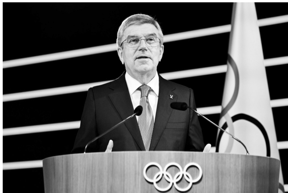
Президент МОК Томас Бах виступає за санкції проти всіх, хто підтримує війну Росії в Україні.

На 139-й сесії МОК виступив і президент НОК України Сергій Бубка, який