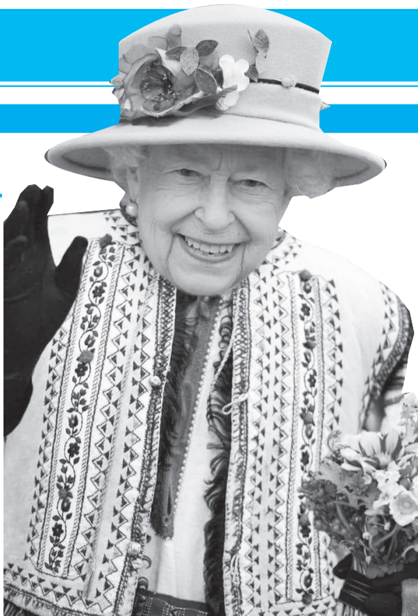
Королева в гуцульському однострої.

Утім підтримку Україні королівська особа висловлює не тільки такими символічними жестами. У березні Єлизавета II зробила «щедру пожертву» для підтримки