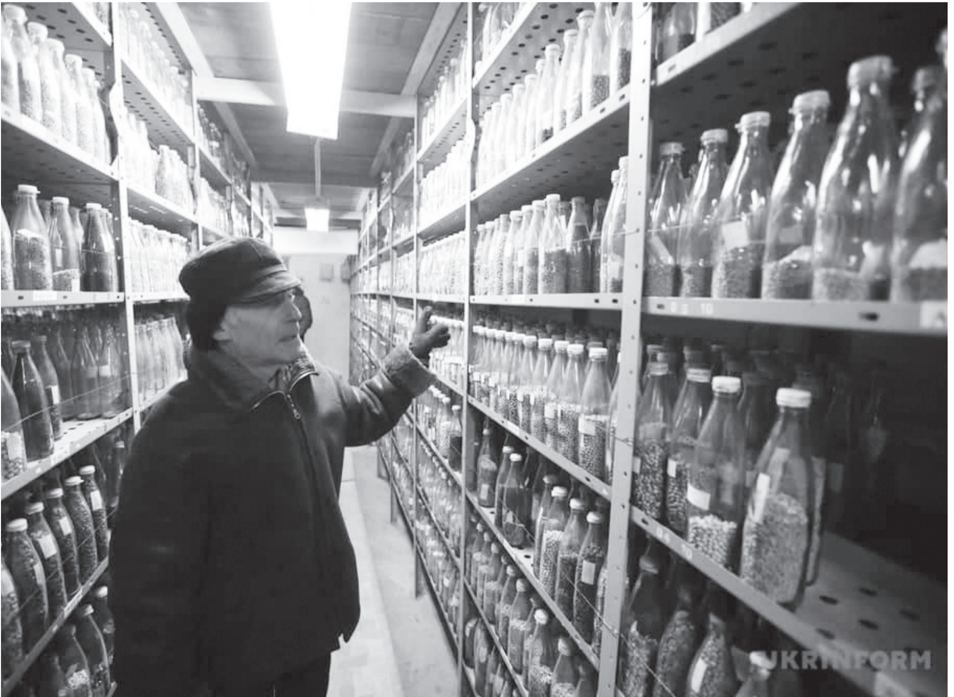
Генетичний банк рослин вцілів, але з оновленням зразків можуть бути проблеми.

Передплатіть «Україну молоду» на друге півріччя