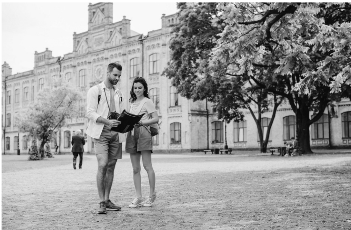
Ми готові до ЗНО.

«Ви маєте показати перспективу, що хочете зробити з набутими знаннями, і пояснити, чому університет має піти вам назустріч і зарахувати вас на навчання».