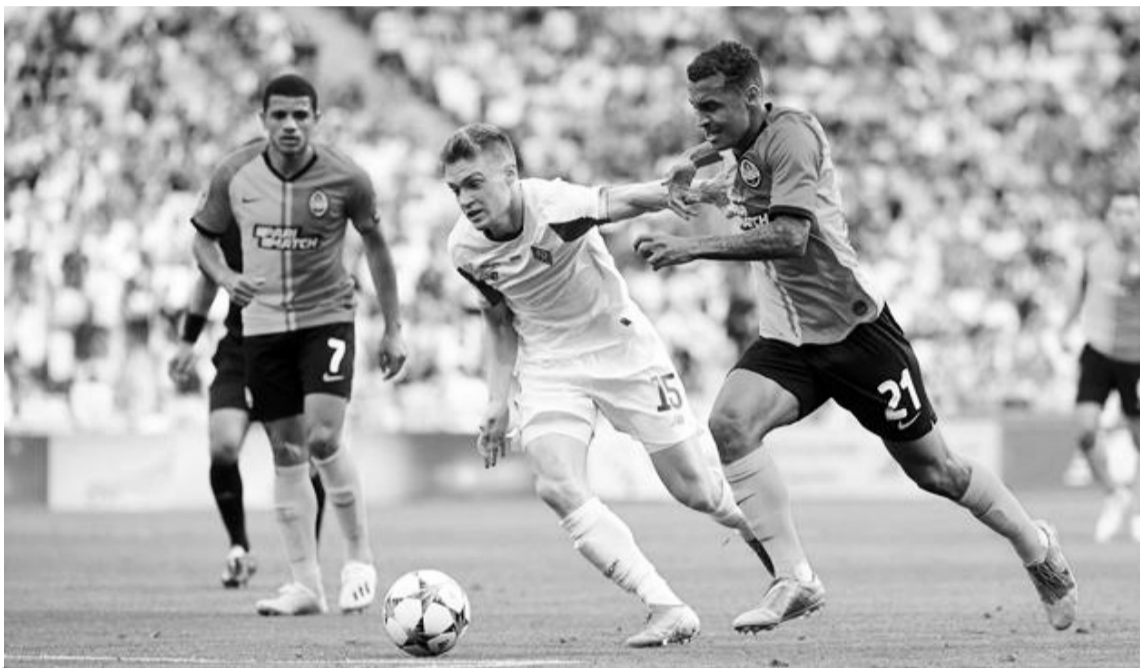
Флагмани вітчизняного футболу вже готуються до нового єврокубкового сезону.

У другому раунді відбір розпочнуть чотири клуби. На цьому етапі «Динамо» буде однією з двох сіяних команд, відтак серед можливих суперників — «Ларнака» з Кіпру або ж турецький «Фенербахче». У разі виходу до третього кваліфікаційного раунду «Динамо» знову опиниться серед сіяних команд. І там на київський колектив можуть очікувати «Монако» (Франція), «Штурм» (Австрія) чи «Юніон» (Бельгія). Щодо заключного етапу відбору кваліфікації ЛЧ-2022/2023, то там сіяного статусу в «Динамо» вже не буде, а серед найімовірніших візаві — потужні португальська «Бенфіка» та шотландський «Рейджерс». Водночас відзначимо, що успішне подолання друго-