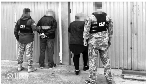
Спритники шахраювали на загальну суму майже 200 тисяч гривень.

Смілянська міська рада сприяла виготовленню та придбанню допомоги і надала зловмисникам майже 2 тис. банок тушонки. Однак псевдоволонтери вирішили на-