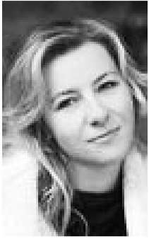
Тетяна НІКОЛАЄНКО журналіст, автор «Цензор.НЕТ»