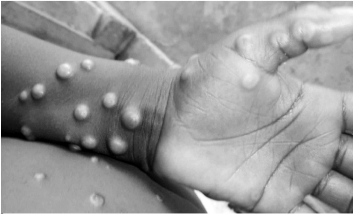
Характерні висипання на шкірі — виразна ознака мавпячої віспи.

У середньому хвороба триває два тижні (найдовший період — чотири тижні) і смертність від неї — не така загрозлива, як, наприклад, при захворюванні на ковід. Згідно з медичною статистикою з Африканського континенту, де ця хвороба найбільш поши-