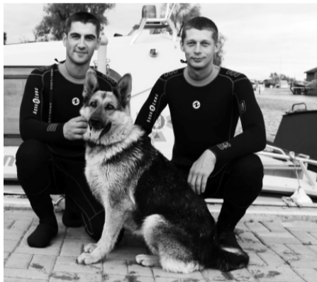
Найда служить у групі пошукових робіт загону спецпризначення.

Кажуть, що з перших днів знайомства Найда проявляла свою дисциплінованість та пристрась до води. Тож водолази вирішили навчити її необхідних команд, зокрема під час порятунку на воді. Наразі собака-водолаз вже впе-