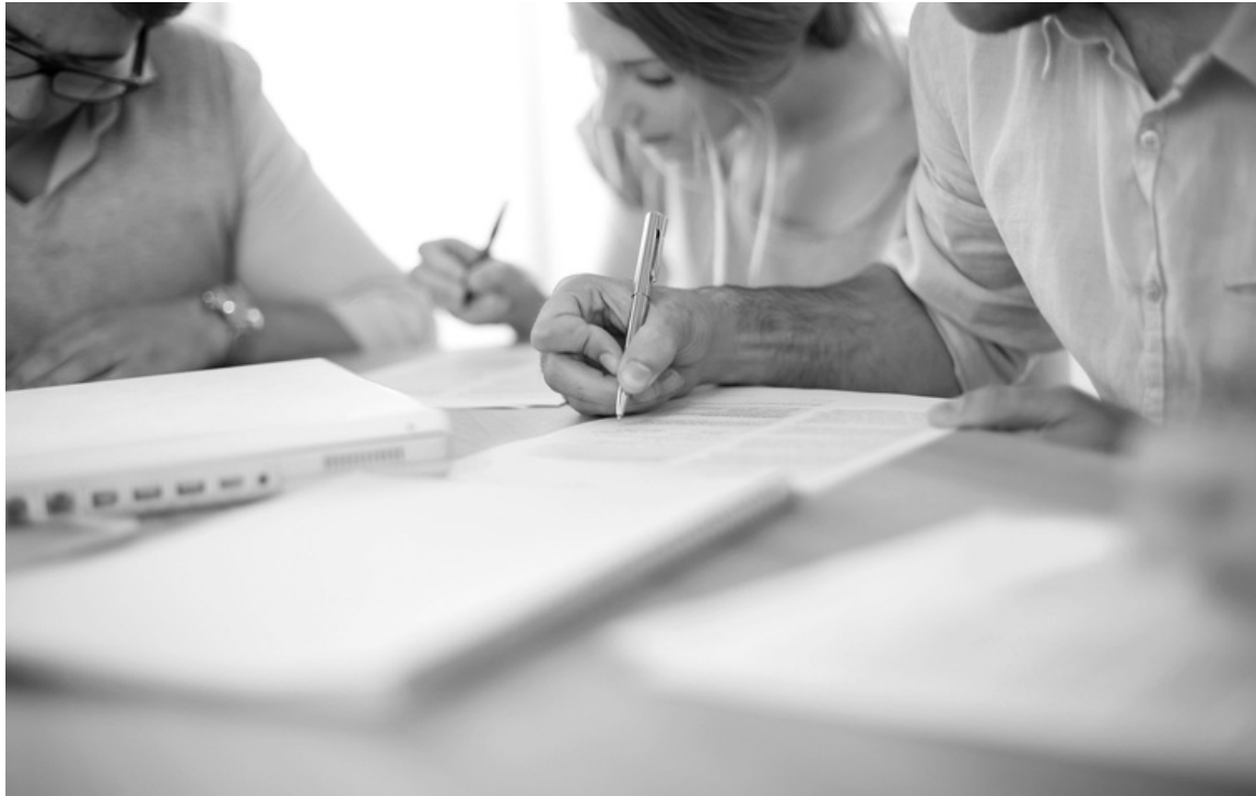
Для багатьох абітурієнтів мотиваційний лист може мати вирішальне значення при вступі.

«Шукайте всю важливу інформацію. Інколи на своїх сайтах виші пишуть, куди планують працевлаштовувати випус-