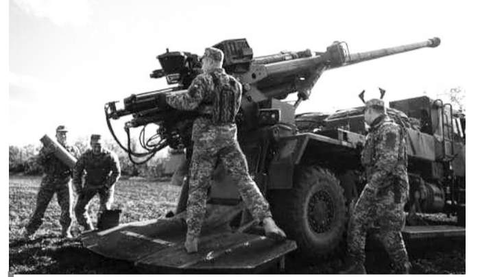
На передовій захищають Україну артилерійські установки нового покоління Caesar.

Гарячою точкою фронту продовжує залишатися Харківщина. В Ізюмському районі війська РФ намагалися провести розвідку боем, але були відкинуті на висхідній позиції. Аналогічна ситуація склалася і поблизу населеного пункту Пасіка. Водночас російська артилерія й надалі нищить інфраструктуру області. «Окупанти обстріляли Дергачівську громаду, — повідомив голова військової адміністрації регіону Олег Синегубов. — У результаті влучення снаряда спалахнув торговельний заклад. На жаль, 69-річна жінка загинула, ще одна особа отримала поранення. У селі Савинці Ізюмсько-