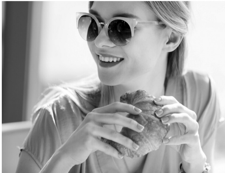
Звичка часто «заїдати» стрес солодощами може обернутися негативними наслідками для здоров'я.

Тож лікарка-дієтолог радить поповнювати раціон дикорослою їжею, додавати до своєї щоденної тарілки свіжої зелені, ягоди (навіть морожені), які мають стійке забарвлення. Все це, на думку пані лікарки, є невід'ємною частиною корисного лікувально-профілактичного харчування. У таких продуктах міститься багато вітаміну С у природній, L-формі, який швидко включається в обмін речовин, міне-