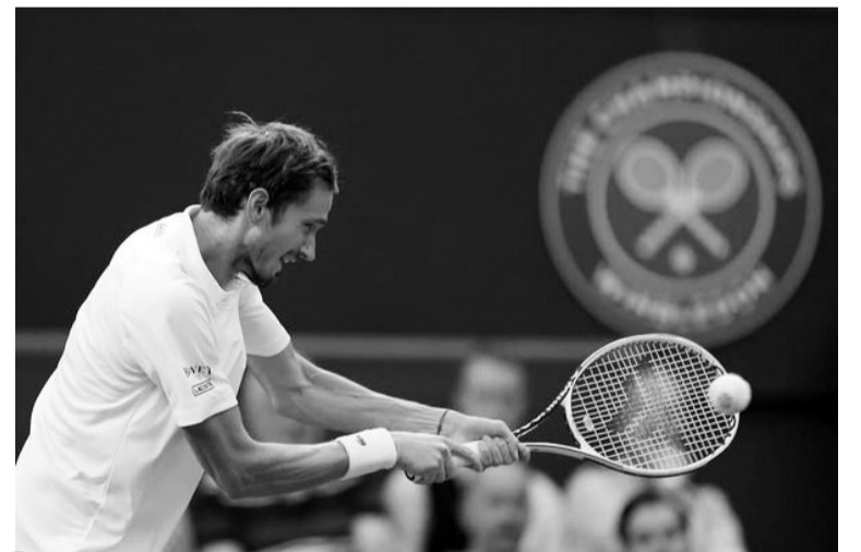
Рішення не пустити росіян і білорусів на трав'яний «шолом» розкололо тенісну спільноту.

«Без рейтингових очок на Уїмблдоні та зняття очок за минулий рік. Жодних