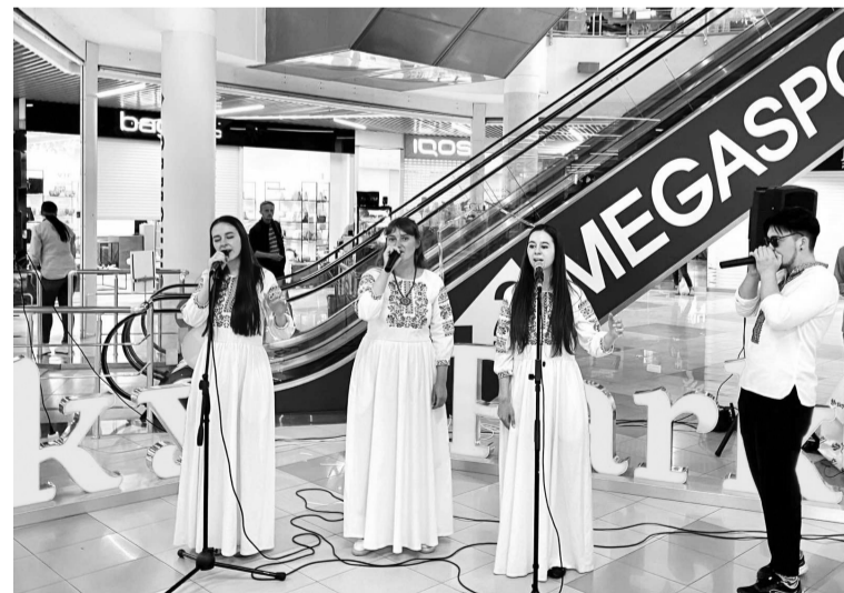
Вокальний ансамбль «Оберіг» із Вінниччини проводить добродійні концерти.

Ще до війни учасники ансамблю розуміли важливість збереження та популяризації українських повстанських пісень. Для підтримки українських військових писали власні авторські пісні, з якими перемогли на всеукраїнських конкурсах. У но-