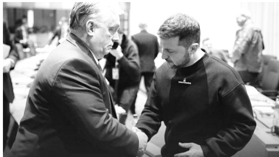
Президент Зеленський — угорському прем'єру Орбану: «Порошенку зась, я тебе, Вікторе, триматиму за руку».

Чому влада про це заговорила? Адже для того, щоб був якийсь референдум, потрібні відповідні рішення внаслідок переговорного процесу між Україною та росією.