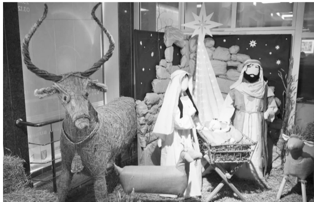
Виставка «Українська зима: від Романа до Йордана».

У Києві показують новорічні прикраси від кінця XIX століття до сучасності й розповідають про передріздвяні традиції