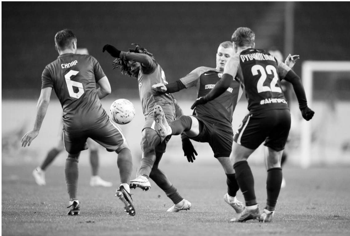
Несподівано поступившись удома «Ворсклі», «Дніпро-1» втратив одноосібне лідерство в чемпіонаті країни. Фото з сайту scdnipro1.com.ua.

Обидва вітчизняні гранди зберігають за собою статус прихованого лідера чемпіонату