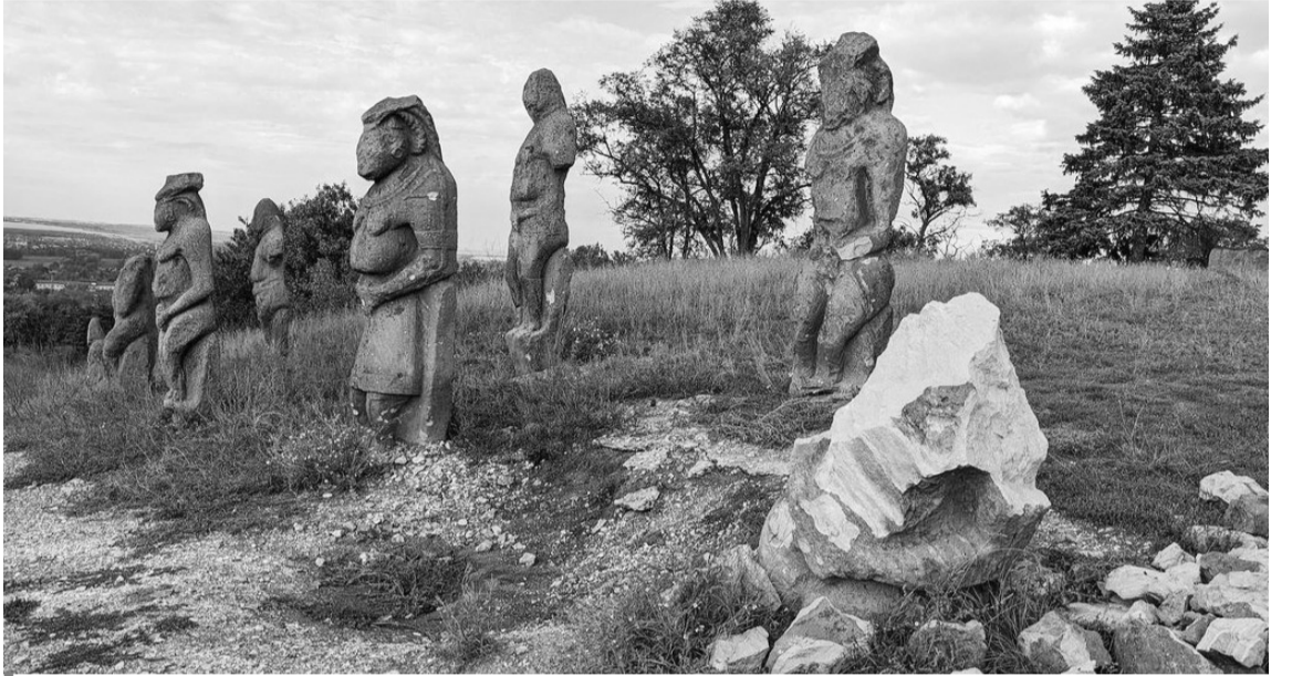
Половецькі баби після «прильотів».

Не менш привабливим для мародерів міг стати і оклад книги, виготовлений зі срібла з позолотою у стилі українського бароко. Отож коли Ізюм окупували німецькі війська, тодішні музейники врятували його, закопавши у землю. З рашистами історія повторилася, але, розуміючи, що чергового «заземлення» духовний раритет може не витри-