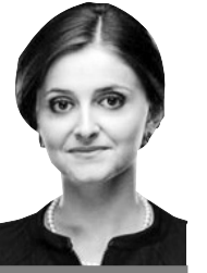
Ольга Василевська-Смаглюк народна депутатка

«Якщо вашій сім'ї близька проблема оформлення кредитів кимось із рідних на ігри в казино, гральних автоматах чи для ставки букмекерам, пройдіть процедуру внесення відомостей про це в реєстр — більше кредитів вашому родичу не даватимуть».