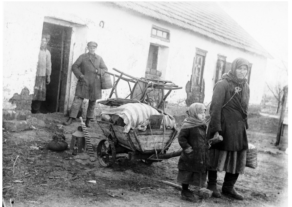
Донеччина, село Удачне. Жінку й дитину радянська влада виселяє через відмову сім'ї вступити в колгосп.

Іван ніби передчував: його з надломленим здоров'ям також може спіткати лихо. Тому просив якнайскоріше прислати теплу близну й кожуха, а також сухарів і сала. Родина швидко виконала прохання