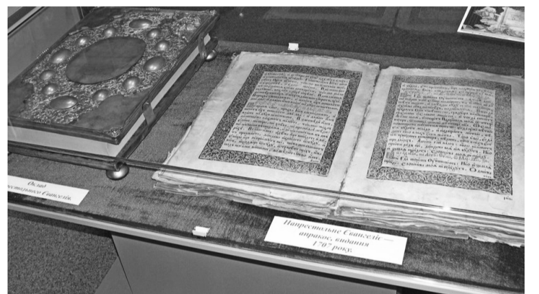
Напрестольне Євангеліє 1707 року, подароване місту гетьманом Іваном Мазепою, до війни.

Уявити ізюмську гору Кременець без кам'яних баб навіть зараз досить складно. Прекрасний вид, що відкри-