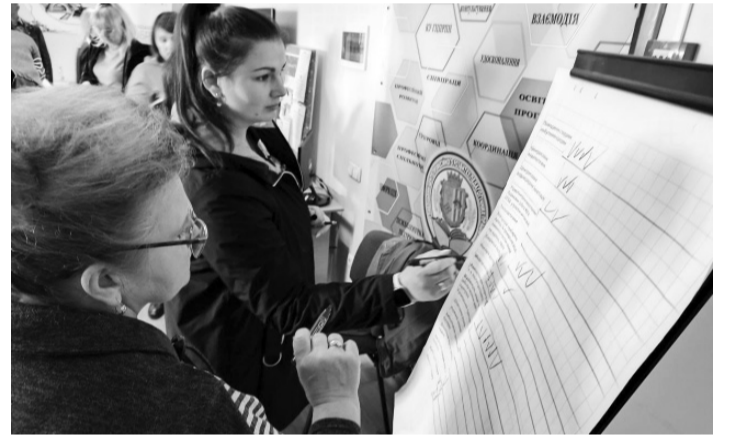
«Потреби мешканців громад-партнерок Програми USAID DOBRE спочатку обговорили у форматі «світлове кафе» — тобто в наших групах. І люди самі визначили, яких послуг їхня громада потребує в першу чергу».

застарілі та зношені, тому часто виникають аварійні ситуації. Особливо складно, коли порив стається на відрізу азбестоцементних труб, які значно важче полагодити, ніж чавунні та пластикові. Тому маємо нагальну потребу в заміні мереж на труби з харчового пластику та в спецтехніці для проведення таких робіт.