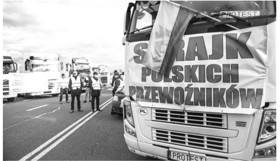
Ще один фронт України — блокада польськими перевізниками.

Отже, увесь цей незрозумілий політичний коктейль разом із польськими силовиками пропусає без тривалих затримок наші військові вантажі, котрі підраховуються дуже швидко, й росія за лічені хвилини може дізнатись, скільки якої зброї та військової