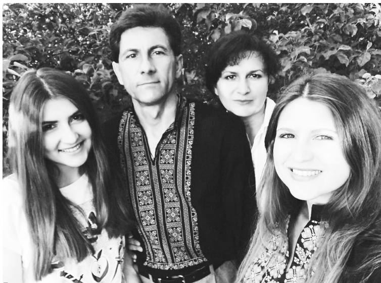
Анатолій Євгенович душе пишався тим, що його обидві доньки — кандидати наук.