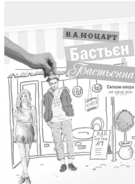
«Бастьєн і Бастьєнна» — звісно ж, про кохання.

Звісно, аматорам музики дуже хочеться й чергової прем'єри «великої»