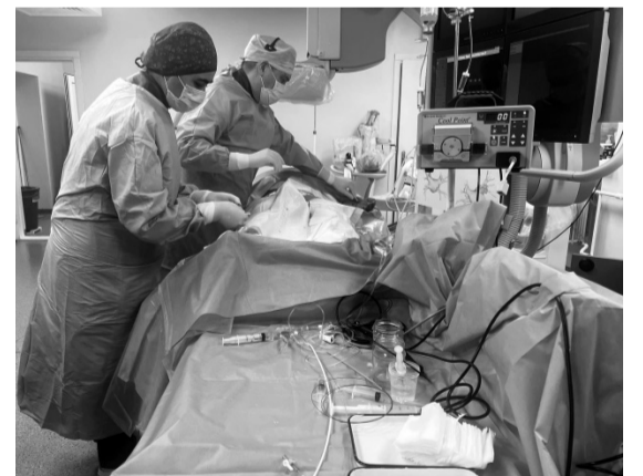
Черкаські кардіологи лікують пацієнтів з аритмією за допомогою найсучаснішої технології — криоабляції.

«Технологія передбачає введення через стегнову вену спеціального балона в порожнину серця. Там знаходяться проблемні ділянки, яка викликає аритмію. За допомогою низької температури -40 її приморозують», — пояснює пан Олег. І уточнює, що це один з найефективніших ме-